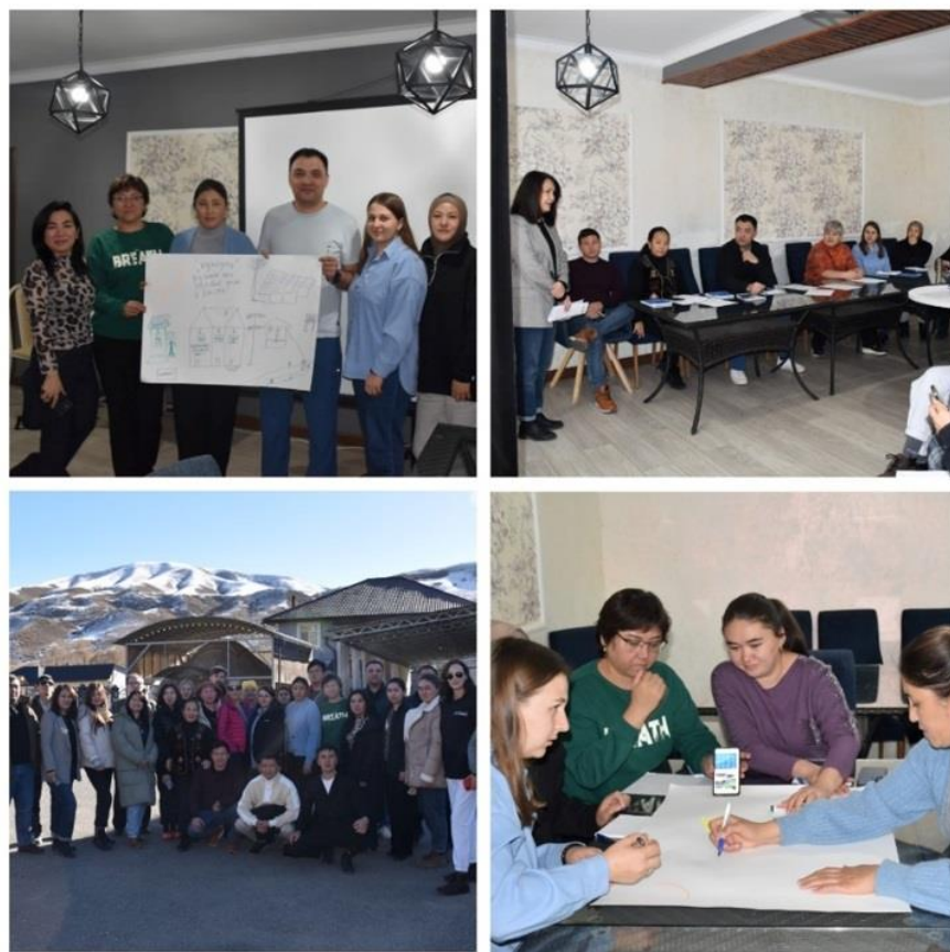
Рисунок 4. Тренинг-семинар в селе Саты