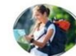
4 Управление отходами и устойчивый туризм