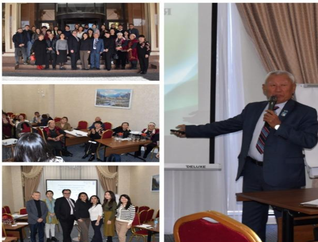
Рисунок 3. Семинар-тренинг в г.Шымкенте