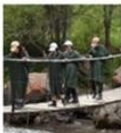
2 Общие и особенные требования к экологическим маршрутам и турам