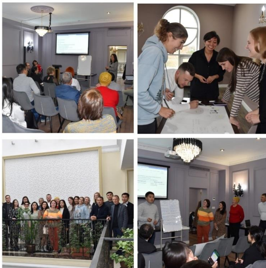
Рисунок 3. Семинар-тренинг в Усть-Каменогорске