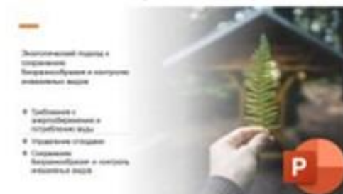
3 Экологический подход к сохранению биоразнообразия