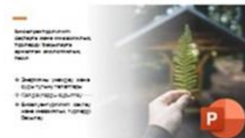
3 Биоәртүрлілікті сақтаудың экологиялық тәсілі[2]