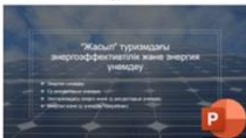
5 Жасыл Туризмдегі энергия үнемдеу және