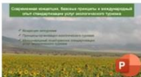
1 Современная концепция экотуризма