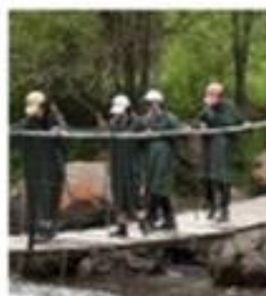
2 Экологиялық туристік маршруттар мен экологиялық турларға қойылатын жалпы және арнайы талаптар