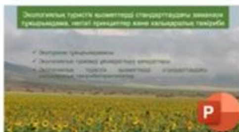
1 Экологиялық туристік қызметтерді стандарттаудағы заманауи тұжырымдама, негізгі принциптер және халықаралық тәжірибе