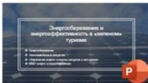
5 Энергосбережение и энергоэффективность